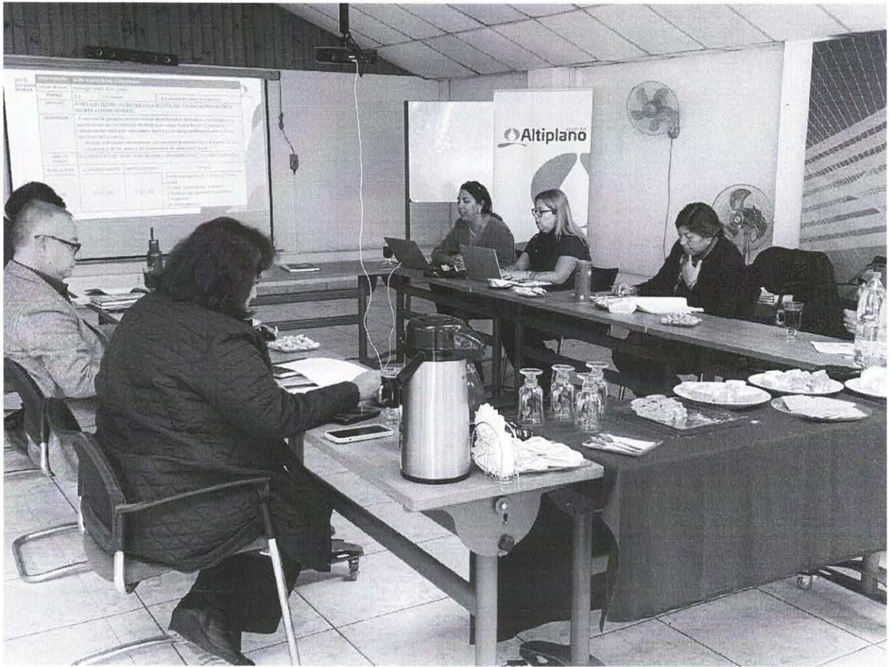
Fotografía Comisión Adjudicadora Arica